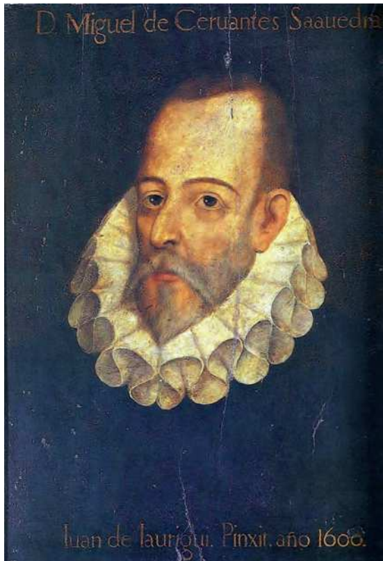
Fig. 4.- Supuesto retrato de Miguel de Cervantes, atribuido a Juan de Jáuregui. Real Academia Española.

ellas es la edición del Quijote cuyas líneas maestras dejó transcritas en su cuaderno de notas. Dado su carácter minucioso, sabemos incluso la fecha en que concibió ese proyecto y el lugar: 12 de abril de 1880 a las 12 de la mañana estando en la calle de las Nieves junto a la reja que da a la calle del Santísimo. De la detallada descripción podemos destacar varias cosas. Su amor por Valencia que le lleva a incluir tanto el escudo de la ciudad de Valencia como el sello o escudo de la