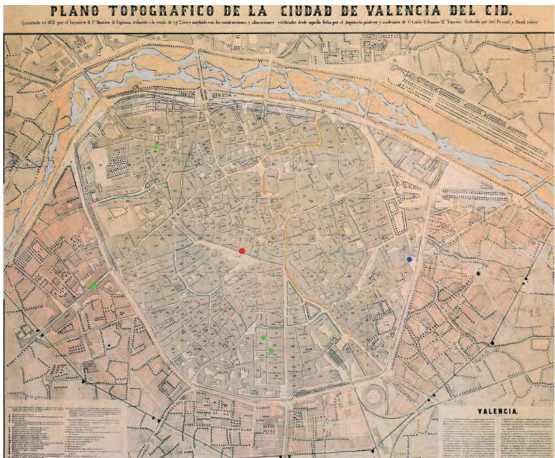
Fig. 2.- Distribución de los inmuebles legados por Estanislao Sacristán y Mateu a sus hijos en 1854. En rojo, ubicación de la droguería de la Luna en plena plaza del Mercado. En azul, domicilio principal donde vivirá Estanislao Sacristán y Ferrer y donde guardará su colección. En verde, otras propiedades.